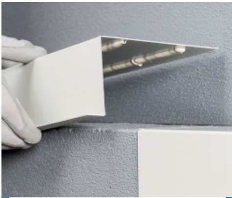
Flexible Verklebung von Bau- und Formteilen