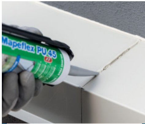
Flexibles Verschiessen von Bauteilfugen